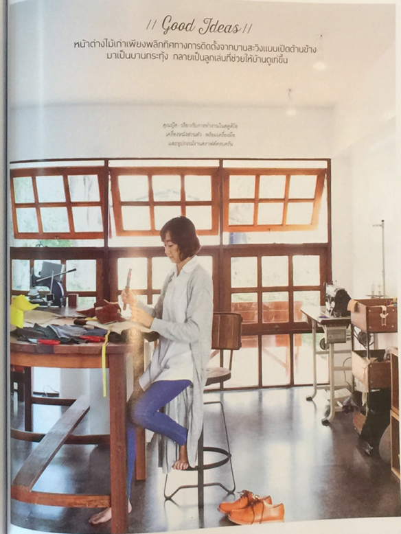
ชุดโต๊ะ - เก้าอี้ไม้เก่าทำมาเป็นชุดโต๊ะ โต๊ะกลมสีขาว - พนักเก้าอี้ไม้ และชุดโต๊ะไม้เก่าสีน้ำตาล

หน้าต่างไม้เก่าเพียงพลิกก็กลายเป็นการตกแต่งจากบานสวิงแบบเปิดด้านข้าง มาเป็นบานกระจก กลายเป็นลูกเล่นที่ช่วยให้บ้านดูเก๋ขึ้น