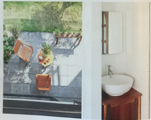
พื้นที่พักผ่อนที่อบอุ่นและสบายใจที่เต็มไปด้วยแสงสว่างจากธรรมชาติ จากพื้นที่ว่างที่กว้างขวางและโปร่งสบาย

// พื้นที่แห่งความสุขที่จากครอบครัวและการทำงาน ก่อร่างสร้างแรงบันดาลใจสู่ผลงานสร้างสรรค์ของทั้งสอง //