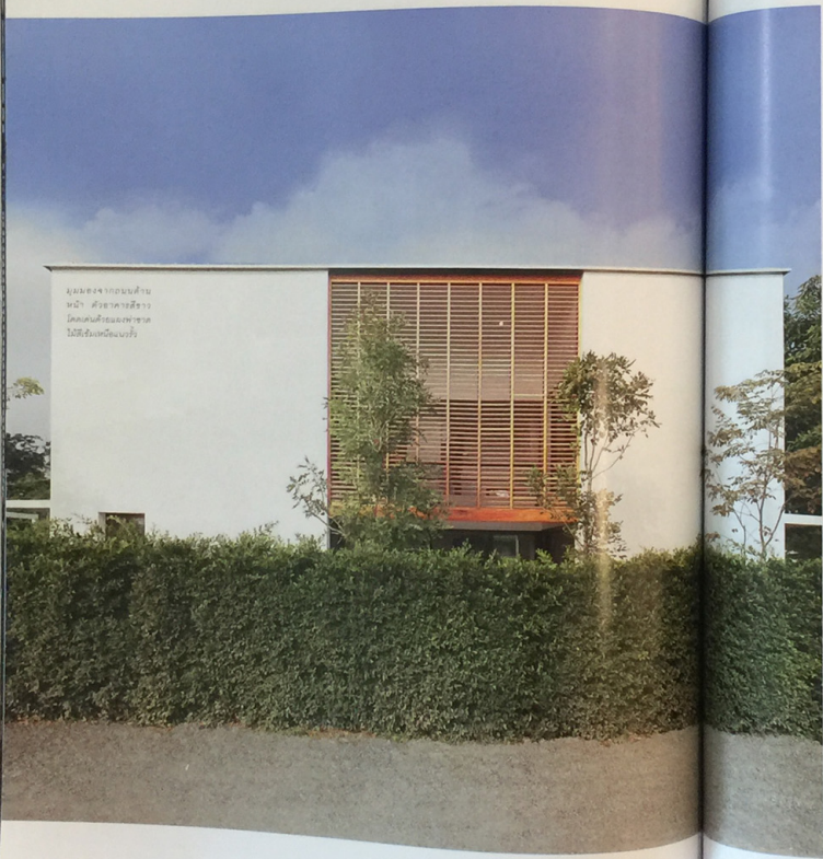
มุมมองจากถนนด้านหน้า บ้าน จากอาคารสีเทา ด้านหลังคือผนังอาคาร ไม้สีเข้มเหมือนไม้จริง