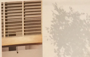
มุมมองจากถนนด้านหน้า บ้าน จากอาคารสีเทา ด้านหลังคือผนังอาคาร ไม้สีเข้มเหมือนไม้จริง

ทั้งคู่ต้องการบ้านที่เรียบง่ายแต่มีความทันสมัยและมีการใช้งานที่สะดวกสบาย นำมาสู่การออกแบบอาคารที่เน้นประโยชน์ใช้สอยที่คุ้มค่าและสวยงาม ด้วยวัสดุที่เลือกมาเป็นอย่างดี ทั้งไม้สีเข้มเหมือนไม้จริงที่เลือกใช้มาตั้งแต่เริ่มแรก และพื้นที่ใช้สอยที่กว้างขวางและสวยงามมาก ทั้งสวนและพื้นที่ใช้สอยที่กว้างขวางมาก