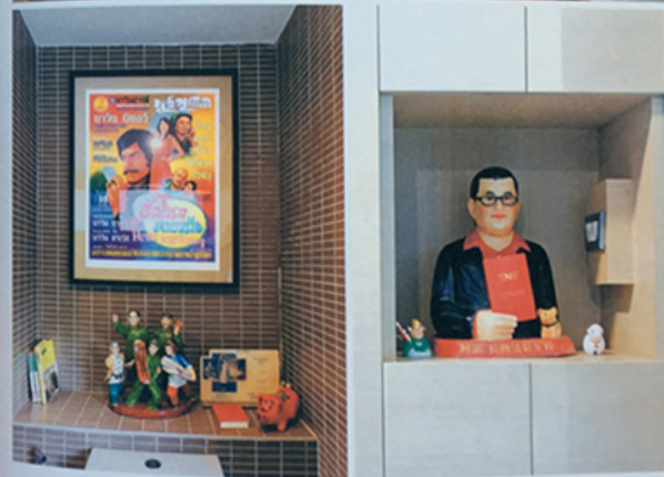
ชั้นวางของตรงทางเข้าประตูไม้ในตำแหน่งประธานพรรค พรรคคอมมิวนิสต์แห่งประเทศไทย ซึ่งนำโดยจางเคี๋ยเป่จาง และแปลย Quotations from Comrade Nevin (2007)