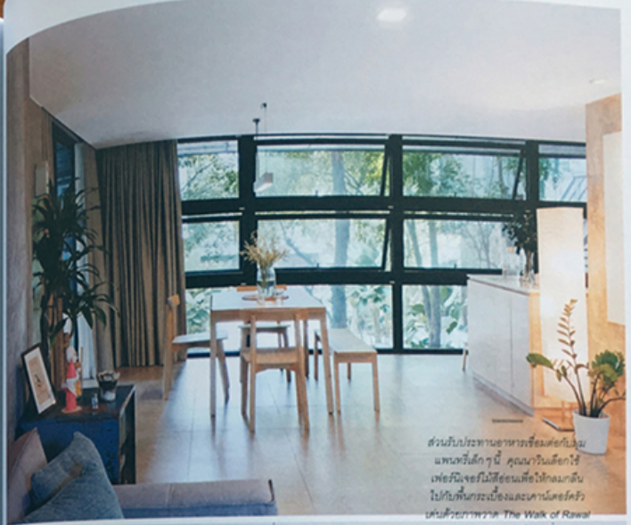
ส่วนรับประทานอาหารเชื่อมต่อกับพื้นที่นั่งเล่นทุกวันนี้ ชุดนอนสีทึบใช้เพื่อมีใจที่ไม่ดีตอนเพื่อไปลงมาถึงไปที่พื้นที่กระเบื้องและคานาโดยตัวแบบด้วยภาพวาด The Walk of Revolt (2015) บนผนังปูนเปลือย พื้นฮอล่าความเป็นมาของกระเบื้องลวดลายคือความเป็นภาพไม้ดำของชุดทอทอวอินเดียผู้เดินทางไกลมาตั้งรกรากในเชียงใหม่วางคู่กับไม้สน ซึ่งสื่อถึงกิจกรรมผ้าในภาคของของกระเบื้อง