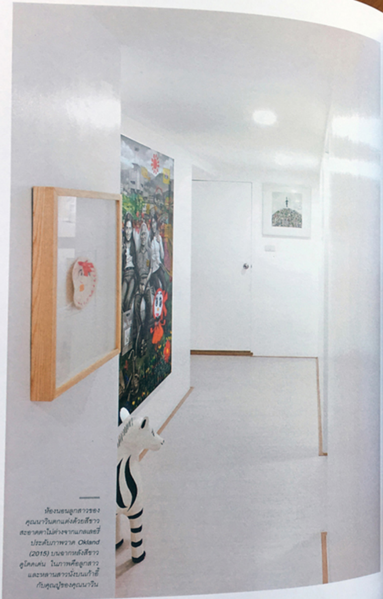
ห้องนอนลูกสาวของ คุณนารีนาถกับคังคังสีขาว สะพานไม้ทำจากแก๊สและอิฐ ประดับภาพวาด Okland (2015) บนฉากหลังสีขาว ดูโดดเด่น ในภาพคือลูกสาว และหลานสาวนั่งบนเก้าอี้ กับคุณปู่ของคุณนารีนาถ