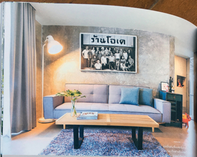
ผนังปูนที่เคลือบสีเทา และสีฟ้าที่ผนังด้าน ซ้าย และผนังที่เคลือบ สีเทาที่ด้านหลังโต๊ะ กาแฟสีไม้ธรรมชาติ ซึ่งภาพ ครอบครัว 'โฮเต' ส่วนบ้าน 'โฮเต' (A Tale of Two Homes) เป็น ที่จัดแสดงที่เมืองเชียงใหม่ จัดสร้างโดยสถาปนิก 'บ้าน' และแสดงภาพถ่าย 'ครอบครัว' ในบ้าน