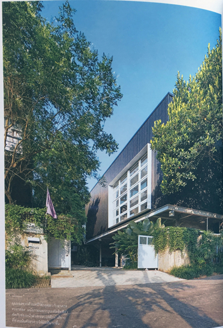
พื้นที่ส่วนนี้คือพื้นที่ที่สตูดิโอจะทำการ รวมห้อง มีมีการแบ่งพื้นที่เพื่อใช้พื้นที่ ศิลปะห้องนี้เพื่อที่จะใช้พื้นที่สำหรับ ที่จัดระเบียบอาคารให้มีความทันสมัย